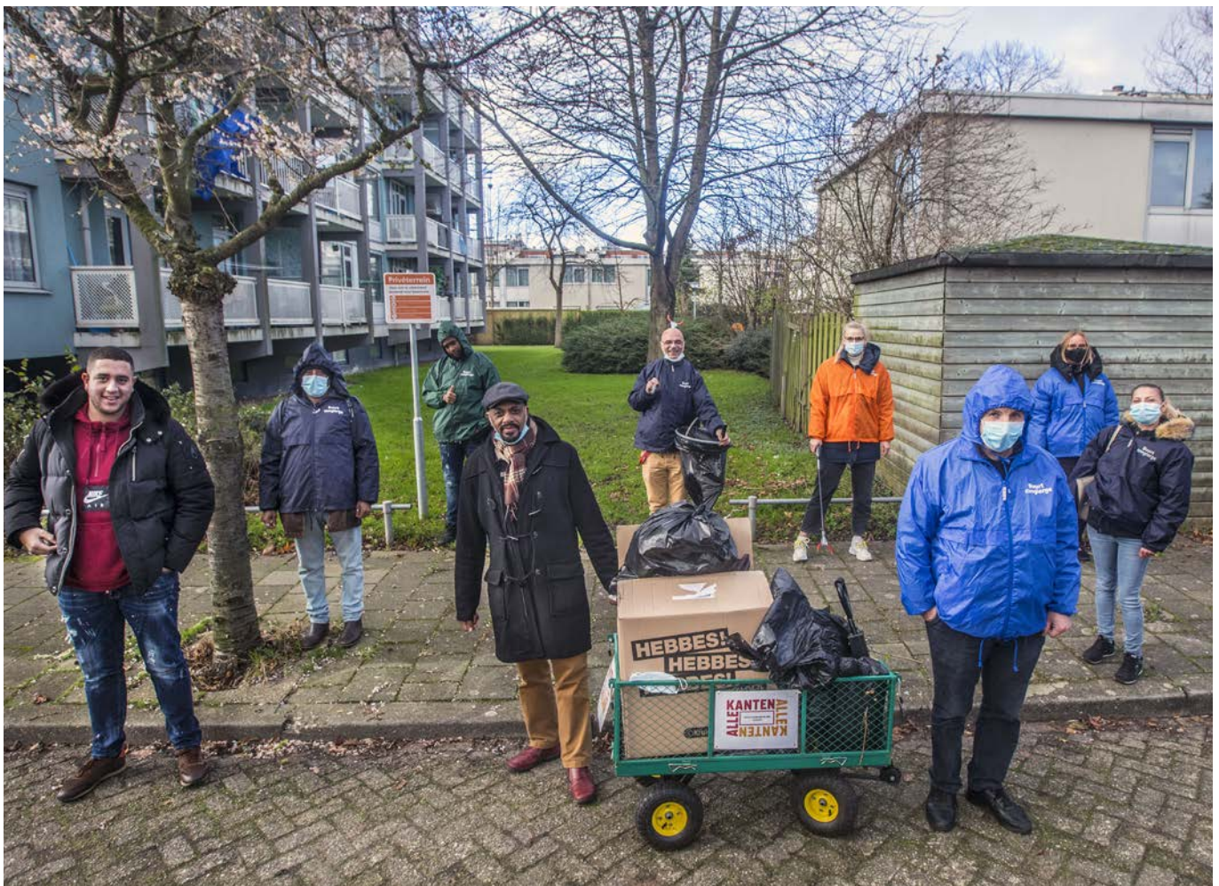
Wekelijkse opruimactie met bewoners in Corona-tijd.

We hebben in twee jaar tijd met medewerkers, vrijwilligers, bewoners en stagiaires dus waanzinnig veel bereikt. Allekanten is een prachtig huis in een kleurrijke wijk. Allekanten zet in op langdurige en duurzame versterking van deze wijk.