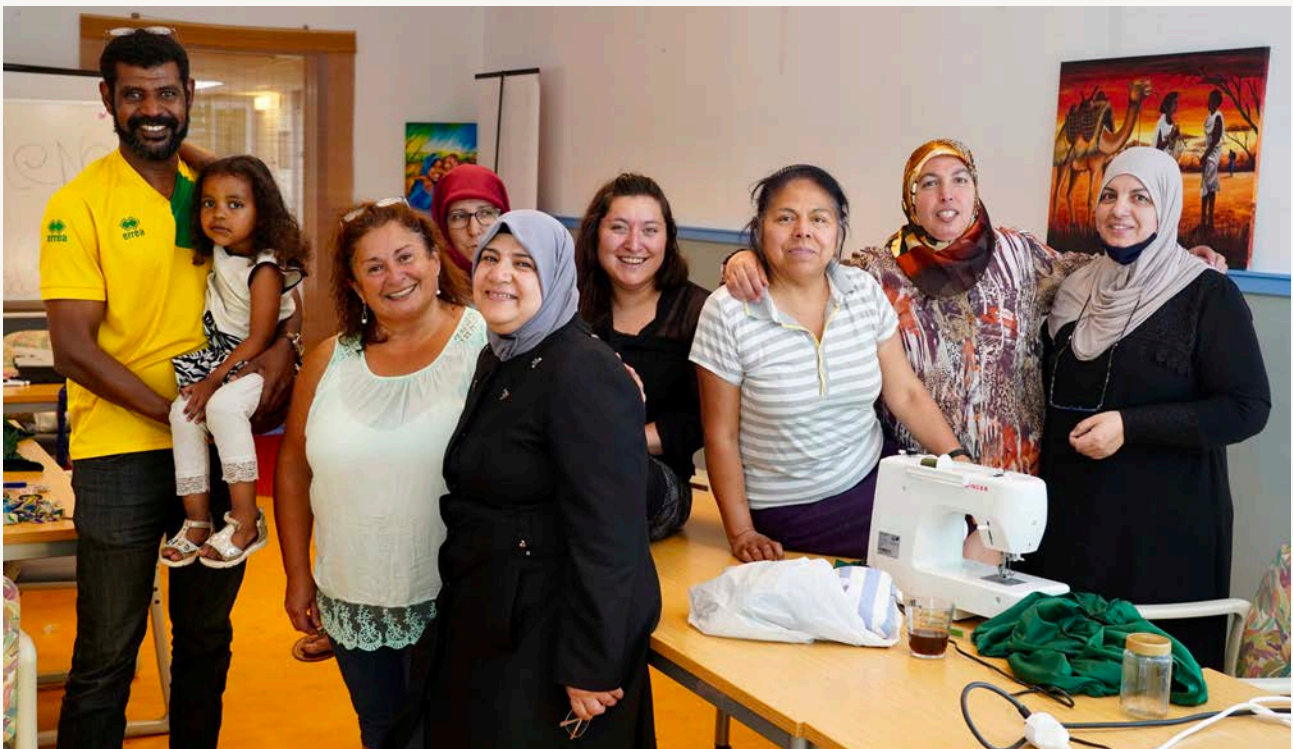
Naailles, de voertaal is hier Nederlands.